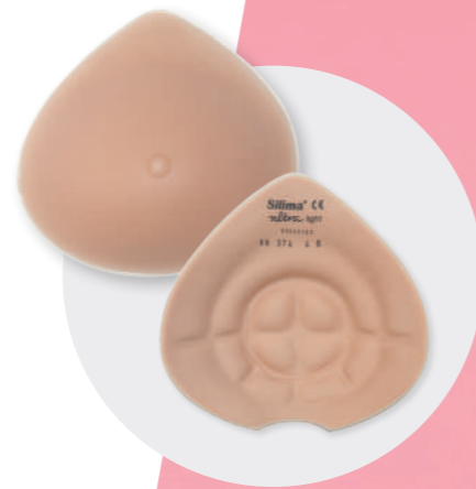
SILIMA® Ultra light

Epithesen als perfekter Begleiter zum Schwimmen, wie die SILIMA® Ultra light. Dank der Ringstruktur und der Aussparung an der Unterseite kann das Wasser leicht ablaufen. Zudem ist die Brustprothese stark gewichtsreduziert - 60% leichter im Vgl. zu herkömmlichen klassischen Epithesen. Ideal für den Sport.