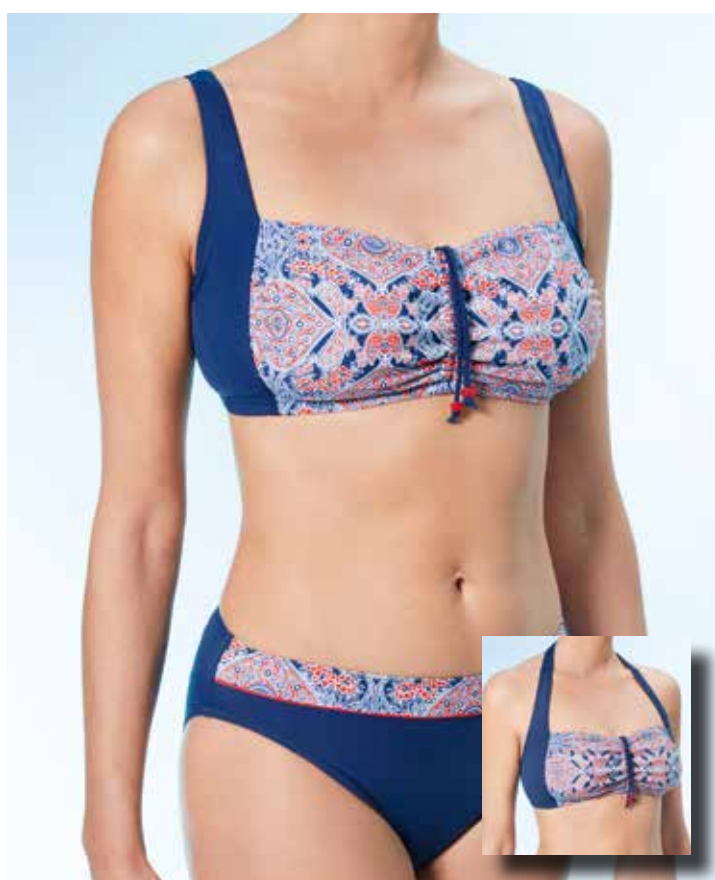
Java 4 Bikini