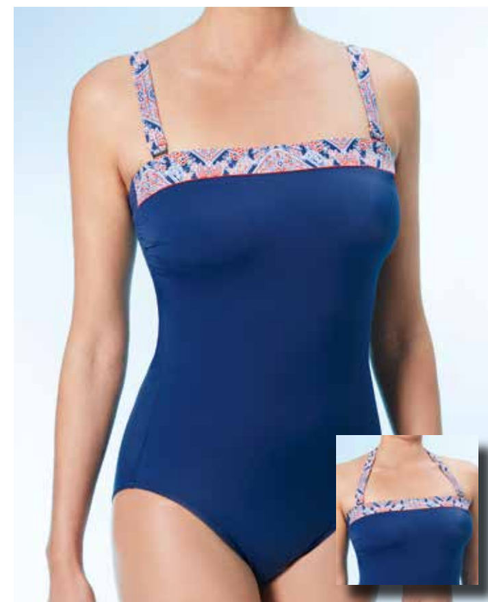
Bali 4 Badeanzug