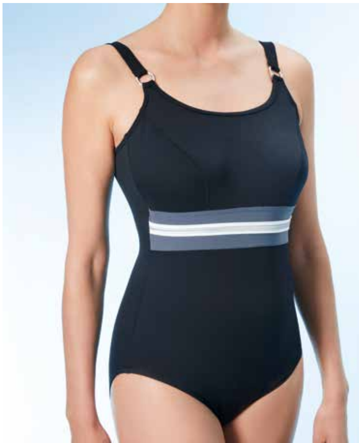
Perth 3 Badeanzug