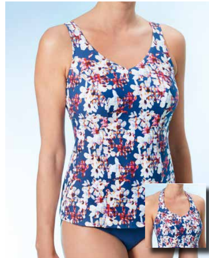
Maui 4 Tankini