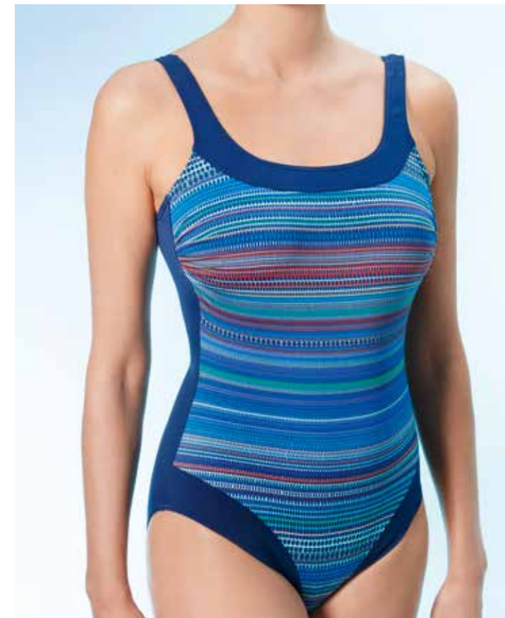
Key West 3 Badeanzug