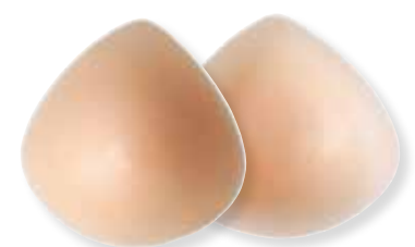
SILIMA® swim form Epithese Art.-No. 66 000 Standard B 2/3, 4/5, 6/7, 8/9, 10/11

Farbabweichungen sind drucktechnisch bedingt möglich. Colour deviations are possible for reasons of printing. Les divergences de couleur sont possibles pour des raisons liées à l'impression.