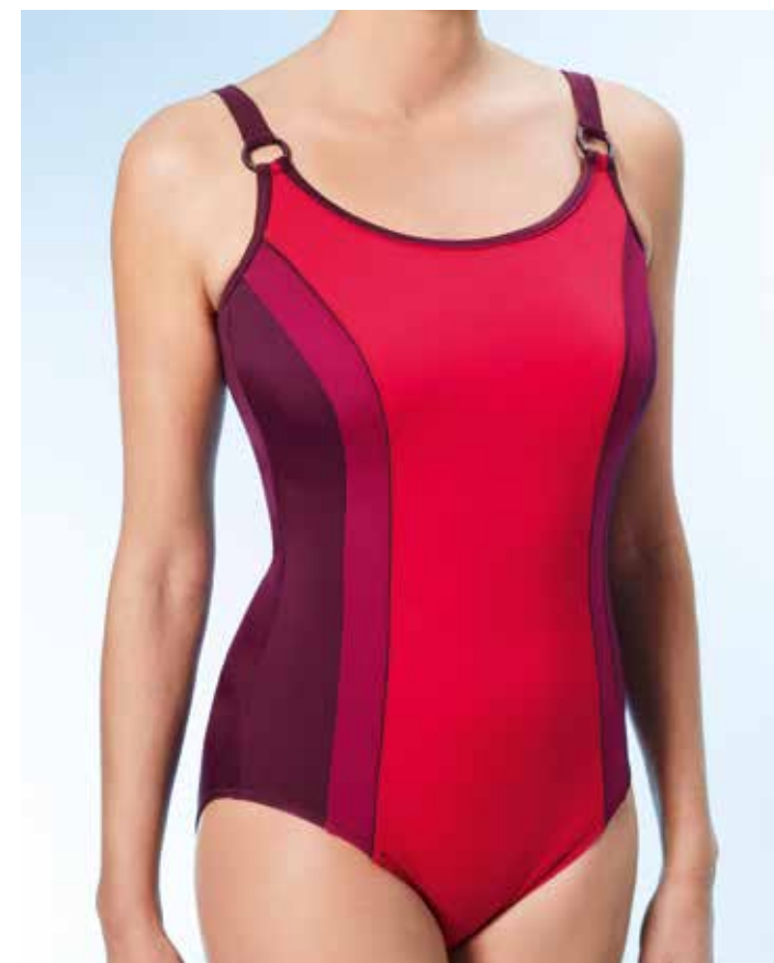
Valencia 3 Badeanzug